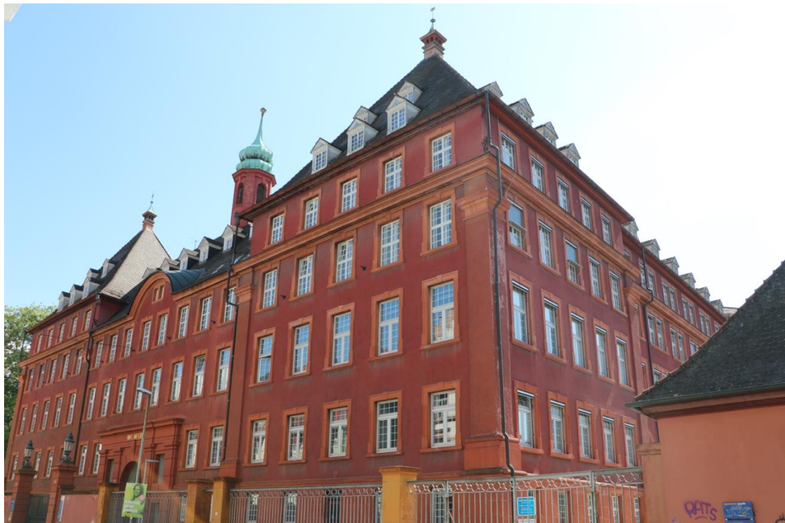
Der Herderbau (Tennenbacher Straße) Das Herz unserer Fakultät

Wir wünschen euch einen guten Start ins Semester – trotz etwaiger Unsicherheiten in Bezug auf Pandemie und Energiekrise.